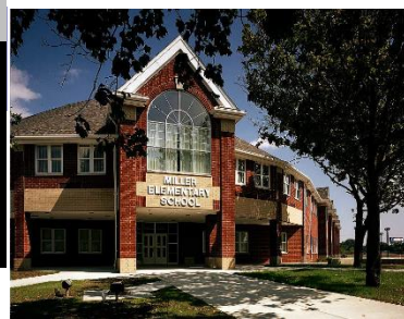
Principal: Radewin Awada March 2019